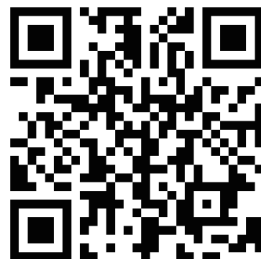
新規登録 QR コード